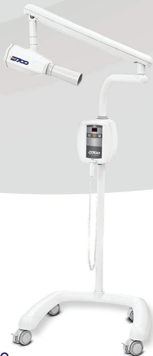
▶ RAIOS X DE PAREDE

Design moderno e prático nas versões coluna móvel e parede. Bloqueio contra disparos acidentais, controle eletrônico com teclado de membrana, visualizador de LED e sistema de dupla colimação, que elimina a formação de raios no feixe principal, evitando a exposição desnecessária do profissional e do paciente, minimizando os riscos à saúde.