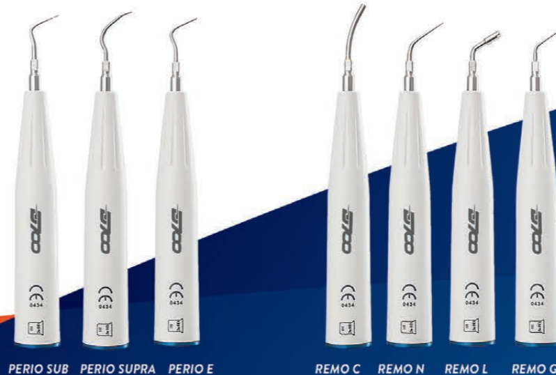
PERIO SUB PERIO SUPRA PERIO E